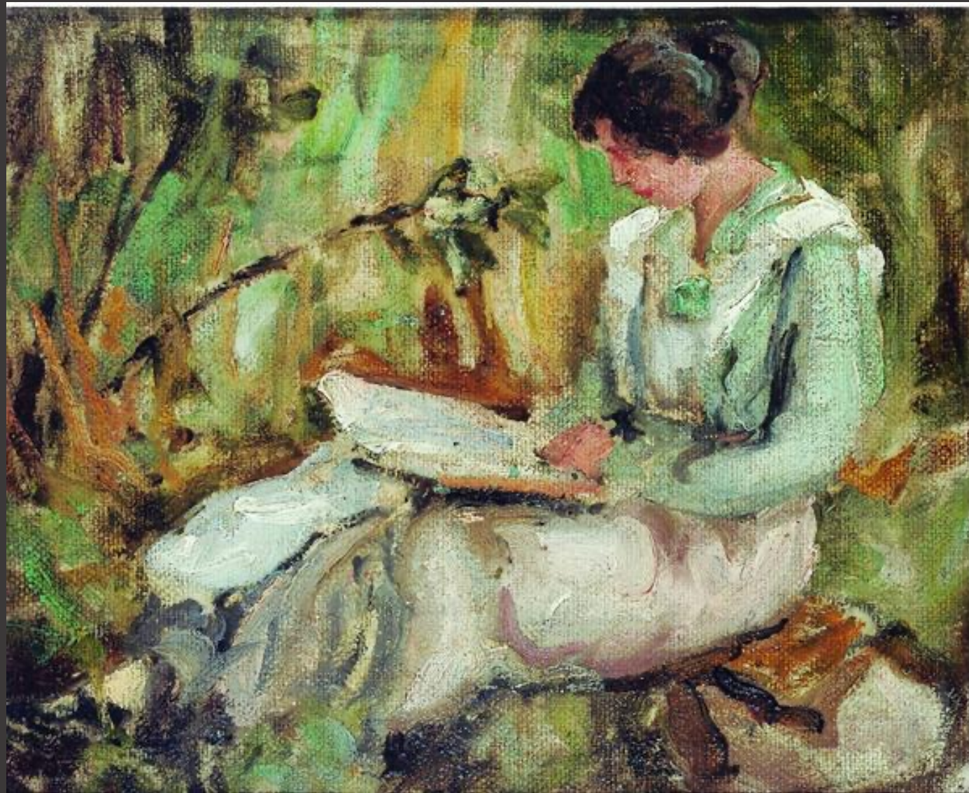
Título: "Estudio en el jardín" Autor: JUAN FRANCISCO GONZALEZ