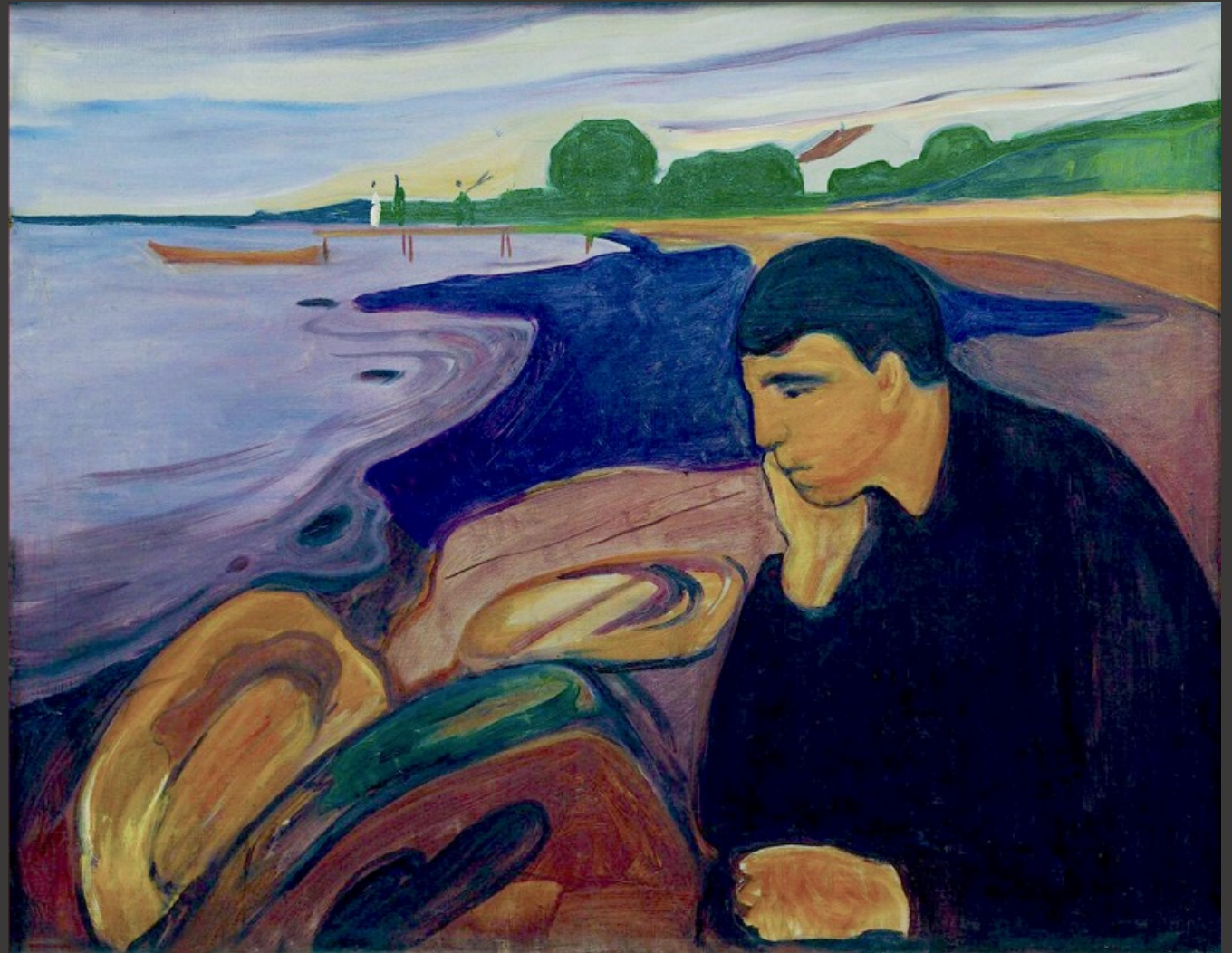
Título: "Melancolía" Autor: EDUARD MUNCH