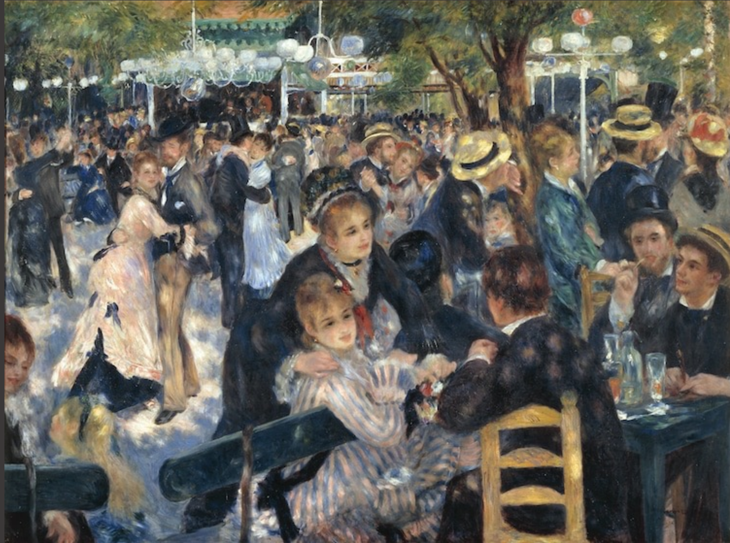
Título: "Moulin de la Gallette" Autor: AUGUSTE RENOIR