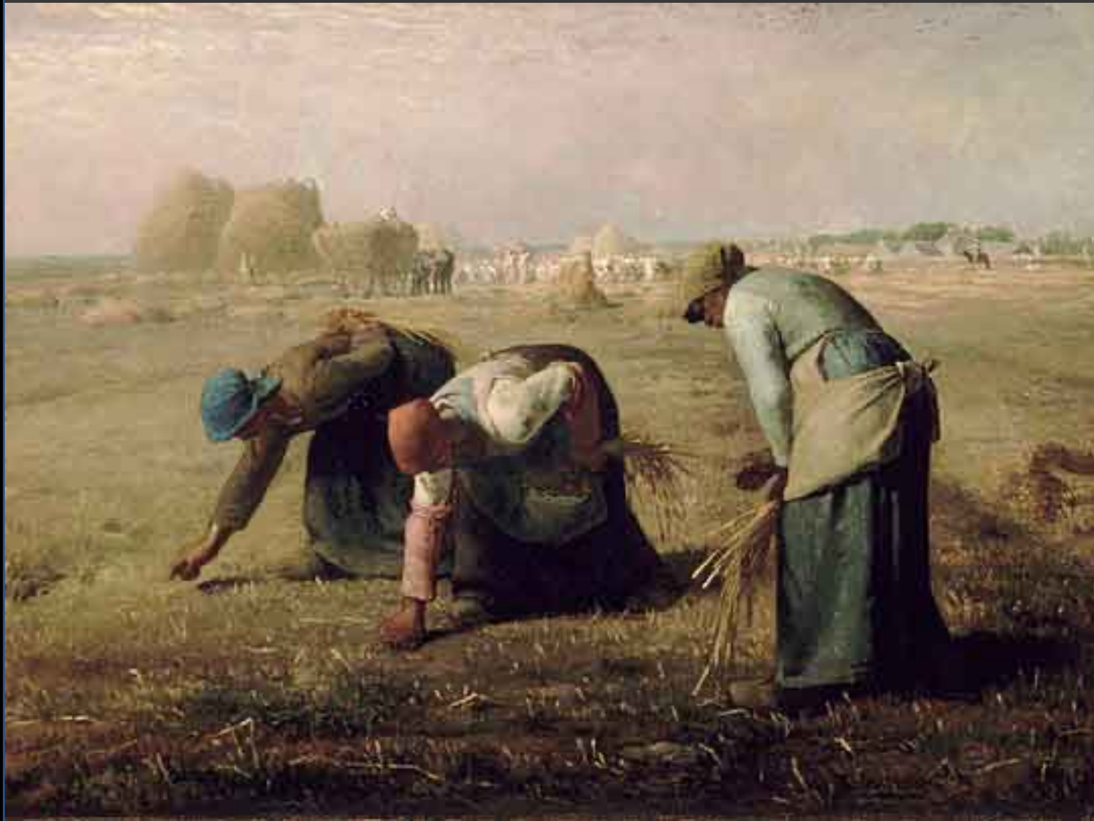
Título: “Las espigadoras” Autor: JEAN FRANCOIS MILLET